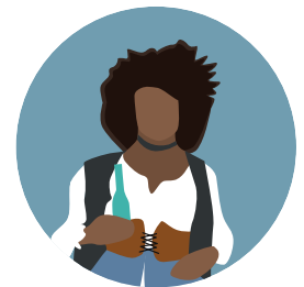
Big Mo Propriétaire du saloon