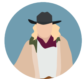
McKees Chercheur d'or