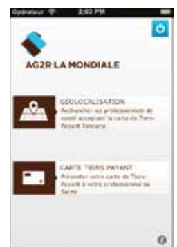
APPLICATION « MA SANTÉ » Des services à destination des bénéficiaires pour les guider dans leurs choix en santé.

Nous vous proposons une application mobile, « Ma Santé », qui vous permet d'afficher votre carte de tiers payant directement sur votre mobile (iPhone, iPad et Android) et de géolocaliser les professionnels de santé acceptant la carte de tiers payant.