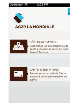
APPLICATION « MA SANTÉ » Des services à destination des bénéficiaires pour les guider dans leurs choix en santé.

Nous vous proposons une application mobile, « Ma Santé », qui vous permet d'afficher votre carte de tiers payant directement sur votre mobile (iPhone, iPad et Android) et de géolocaliser les professionnels de santé acceptant la carte de tiers payant.